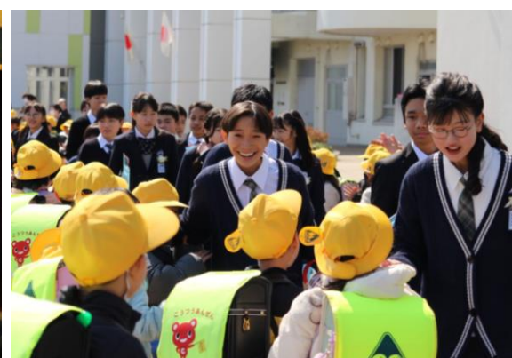
<在校生が見守る中、旅立ち>