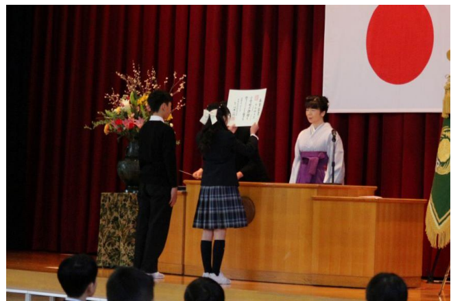
<一人一人に卒業証書を授与>