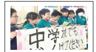
招待状係(メッセージを届ける)