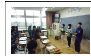
音楽係(下級生に歌を教える)