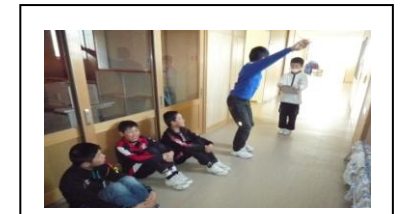
思い出ミニ劇係(劇の練習)