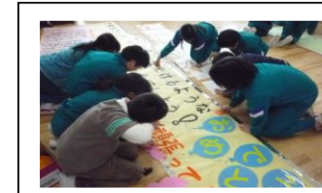
会場教室飾り係(お祝い掲示作り)