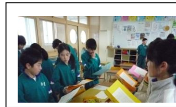
司会・進行係(台本読み)

5日(火)に「卒業を祝う会」が行われます。この集会の中で、児童会活動、学友区等の引き継ぎも行われ、いよいよ5年生は、学校のリーダーとしてのバトンを受け継ぐこととなります。この集会を成功させようと、2月上旬から総合の時間を中心に、計画・準備を進めてきました。休み時間も進んで働く子も見られるようになりました。今は本番に向け、最後の準備に一生懸命取り組んでいます。実行委員の活動ぶりを写真で紹介します。ご都合のつかれる方は、ぜひご参観ください。