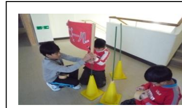
縦割りゲーム係(スタート・ゴール作り)